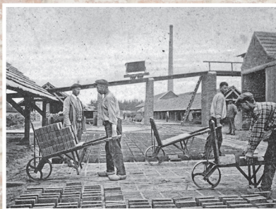
Aan het werk bij de steenfabrieken