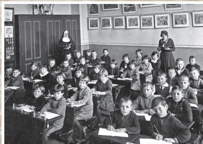
In de klas bij de zusters