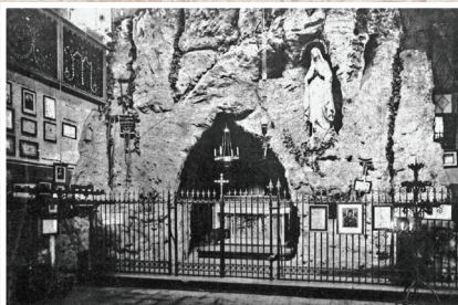
De voormalige Lourdesgrot