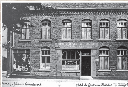
Hotel "de Grot van Lourdes"