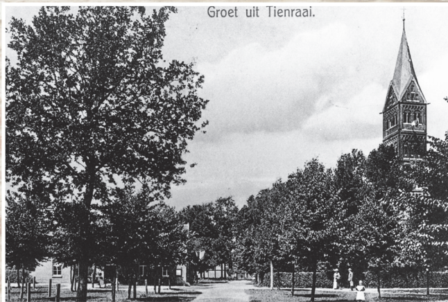
Het dorp Tienray van voor de tweede wereld oorlog.