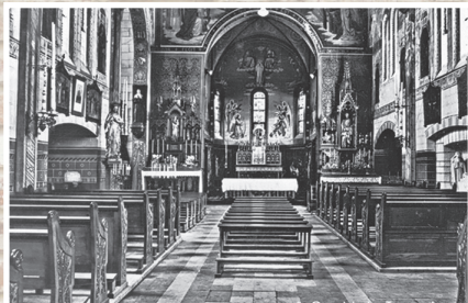
Interieur van de oude kerk